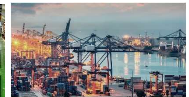
Portuarias y Marinas