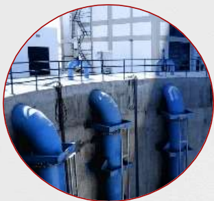
Obras infraestructura Hídrica