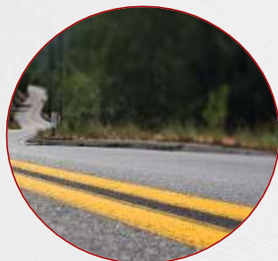
Obras Vías Terrestres